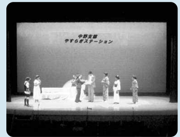
中野支部では「合同やすらぎ」事業として、年1回文化福祉会館ホールで敬老会を実施

役員のみなさんの大変な地域愛と努力によって、3月には「合同やすらぎ」という地域の子供から大人まで、誰もが楽しめる一大イベントを開催し、世代間の交流にも取り組んでいます。