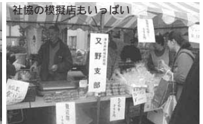
社協の模擬店もいっぱい