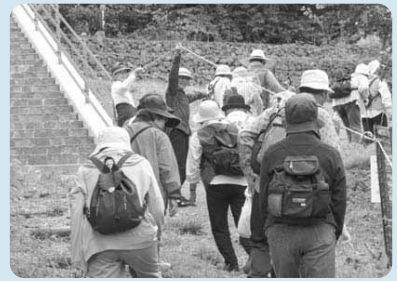
体力づくりと気分転換のためにミニハイキング

また、地域の一人暮らし高齢者や障害者が安心して暮らせるように、支部の「ふれあい委員」が戸別訪問を実施(希望者)するなど、「地域のつながり」を大切にしたい住民福祉活動に心掛けています。