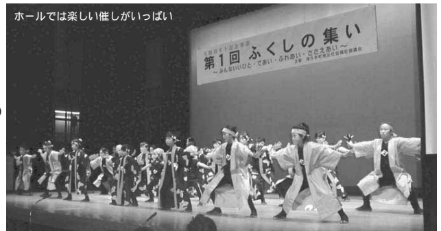
ホールでは楽しい催しがいっぱい

会場向けの送迎バスを用意しています。詳しくはチラシをご覧ください。市社協津久井町地域事務所内地区社協事務局までお問い合わせください。電話：042-784-3393