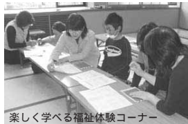
楽しく学べる福祉体験コーナー

高齢者や障害者、そして子どもたちにとって、安心して暮らせる地域をみんなの手で築きましょう。