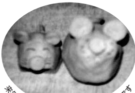
来年の干支のカワイイねずみの親子です