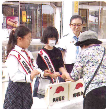
ガールスカウトさんの街頭募金