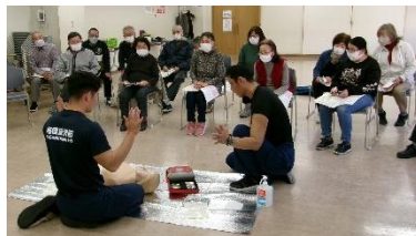
(説明を熱心に見つめる参加者)