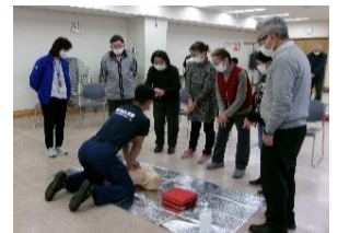
(実技前で緊張の様子)