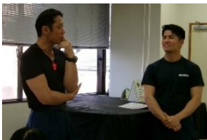
(鍛えた身体の講師のおふたり)

講師から「今日はとてもみなさん熱心で優秀でした。」とお話がありました。今後も定期的に講習会を開催したいと思っています。是非参加をしていただきたいと思います。