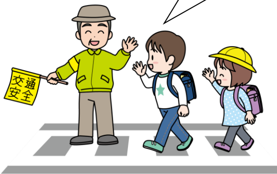
日常の見守り活動の中で