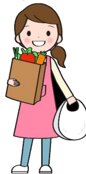
お買い物の途中で